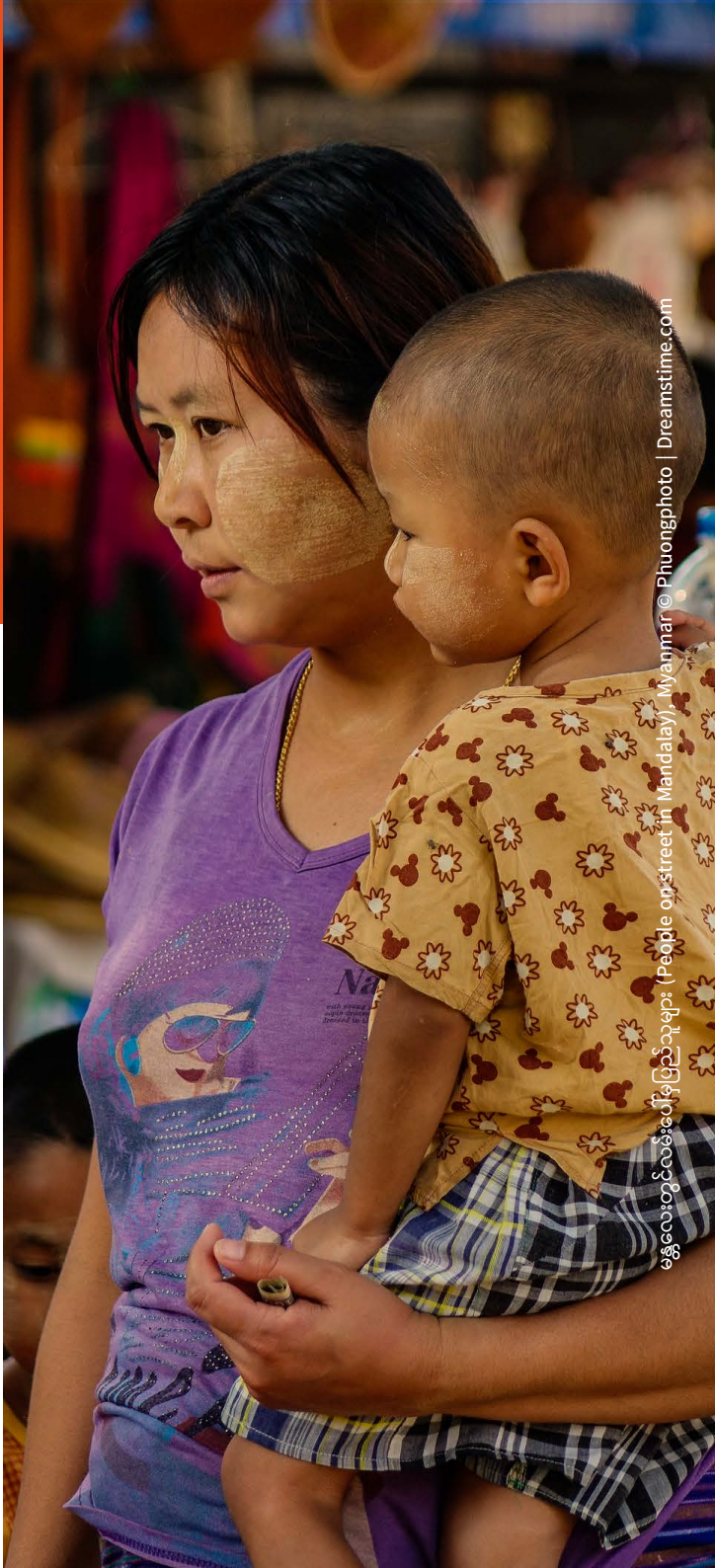
ဧည့်လေ့လာရေးပြည်သူများ (People on Street in Mandalay), Myanmar

များပေးရာတွင် ဒေသခံမိတ်ဖက်များအပေါ်တွင် မှီခိုကြရသည်။ ရခိုင်၊ ကချင်၊ ရှမ်း မြောက်ပိုင်းနှင့် ထိုင်းနယ်စပ်များတွင်လုပ်ငန်းဆောင်ရွက်ရာ၌ ဒေသအခြေအနေ ကို စေ့စပ်သေချာစွာစားလည်မှုရှိနိုင်ရန် ဤကွန်ယက်ကို မှီခိုအသုံးပြုခဲ့ရသည်။ ပိုမို အားကောင်းသော လူသားချင်းစာနာ ထောက်ထားမှုဆိုင်ရာ တုံ့ပြန်ရေးလုပ်ငန်း များဆောင်ရွက်နိုင်ရန် သင်ကြားရေးနှင့် အသိပညာရေး တိုးတက်ရေးဆိုင်ရာ အထောက်အကူပြုသည့် နည်းလမ်းများဖြင့် ဆောင်ရွက်သည်။၂၀၁၆ ခုနှစ်မှစ၍ ထိခိုက် အလွယ်ဆုံးသူများ၊ အဓိကအားဖြင့် ပြည်တွင်းရွှေ့ပြောင်းရသူများ (IDPs) နှင့် ဒုက္ခသည် များအား အရေးပါသောဝန်ဆောင်မှုများပေးရန် ယူကေ လူသားချင်းစာနာထောက်ထား မှုဆိုင်ရာရန်ပုံငွေ စတာလင်ပေါင် ၇၃ သန်းကျော်ကို ဒေသခံ၊ ပြည်တွင်းနှင့် အပြည် ပြည်ဆိုင်ရာ မိတ်ဖက်အဖွဲ့အစည်းများသို့ ပေးအပ်ခဲ့ပြီးဖြစ်သည်။ HARP-F သည် ၂၀၂၀ ခုနှစ် တစ်နှစ်အတွင်း COVID-19 တုံ့ပြန်မှုအတွက် ပထမဦးဆုံးသော တုံ့ပြန်မှု ဆိုင်ရာ ရန်ပုံငွေအဖွဲ့အစည်းတစ်ခုဖြစ်ခဲ့ပြီး၊ ကပ်ရောဂါ ကာကွယ် တားဆီးနိုင်ရေး အတွက် ဧပြီလမှ စတင်ကာ မိတ်ဖက်အဖွဲ့အစည်းများသို့ ထပ်တိုးရန်ပုံငွေ ပေါင် ၄.၃ သန်းကို ပေးအပ်နိုင်ခဲ့သည်။ စစ်အာဏာသိမ်းပြီးနောက်ပိုင်းတွင်လည်း လူသား ချင်းစာနာထောက်ထားသည့် အထောက်အကူများကို ပေးအပ်လျက်ရှိသည်။